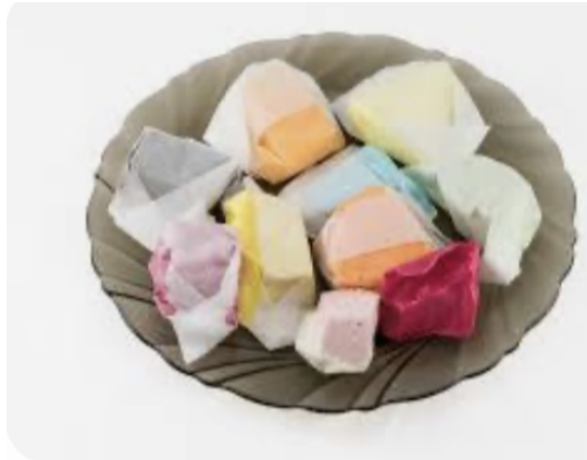
"Pańska skórka" to tradycyjny cukierek domowej roboty, zawinięty w pergamin, sprzedawany głównie w okolicach Warszawy.