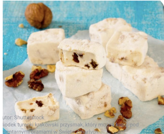
"Miodek turecki" to cukierek tradycyjnie sprzedawany w Krakowie podczas Wszystkich Świętych.