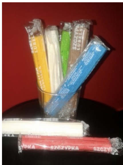
"Szczyпка lubelska" sprzedawana jest na Lubelszczyźnie.