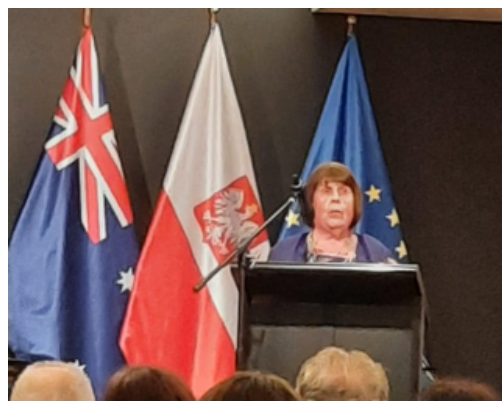
Autor i zdjęcia: Barbara Błaszcyk